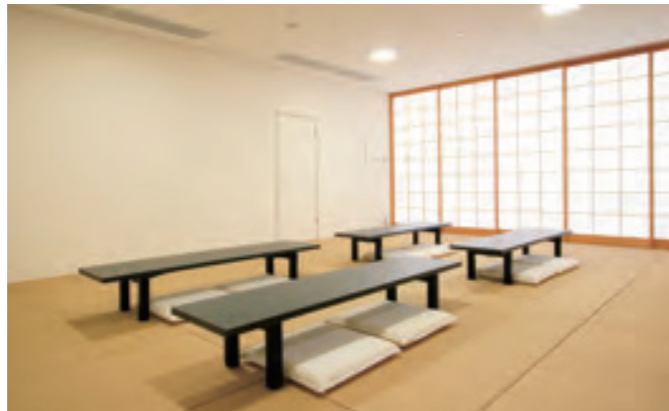
和室(江戸間24畳) 410円/1時間

毎週火曜日(ただし火曜日が祝日の場合は翌日)、1月1日 ※特別開園日 GW期間中および、7月21日～8月31日は火曜日も開園