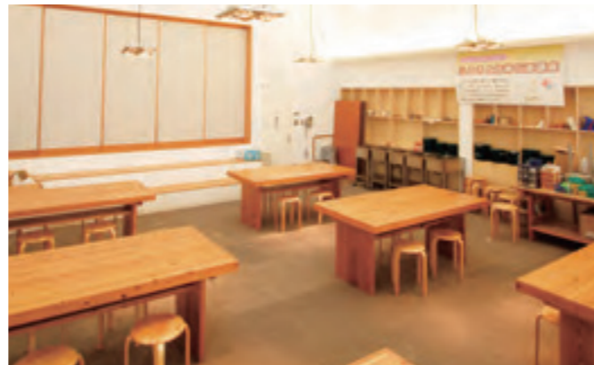
手づくり工房(実習台7台) 930円/1時間