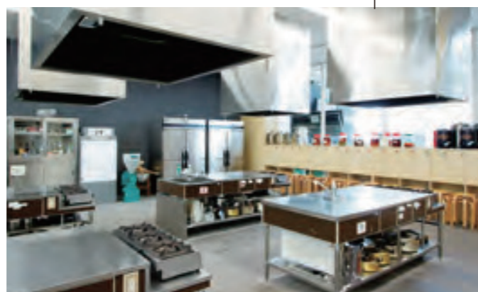
調理実習室(実習台5台) 620円/1時間