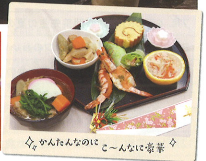
◇かんたんなのに こ〜んなに豪華◇